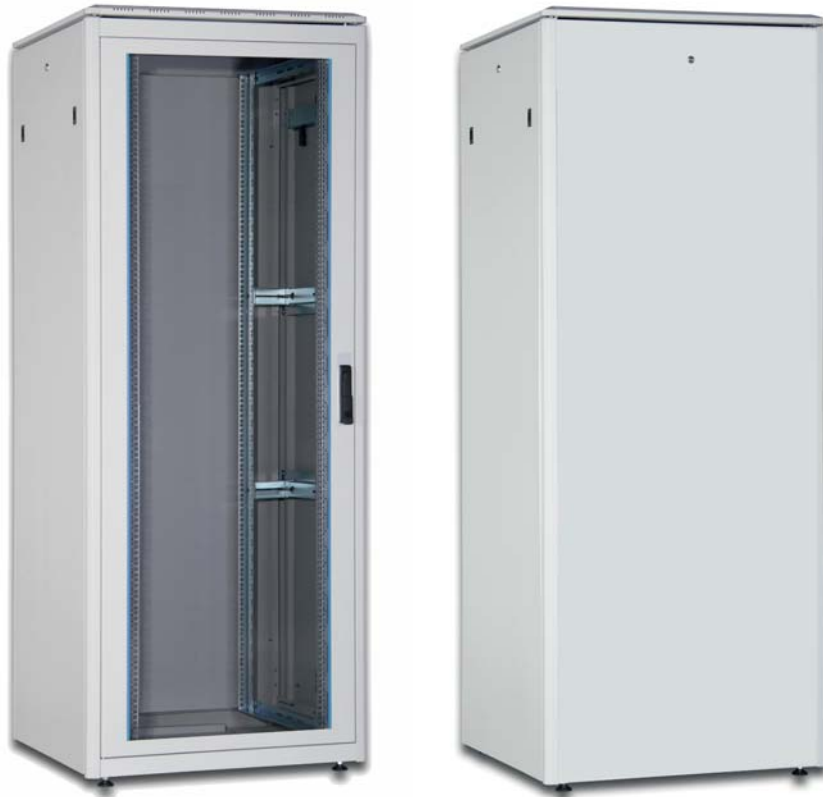
BTS® Netzwerkschrank IT Flex in 800 mm Breite